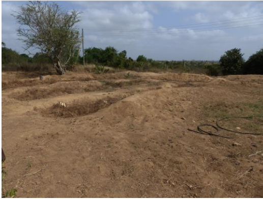
Droogte in de shamba