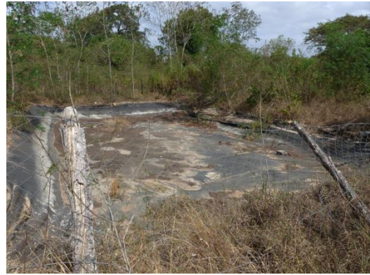
omdat het water ontbreekt

Unit ziet er verder behoorlijk goed onderhouden uit. Redelijke keuken, behoorlijk eten, opgeruimde slaapzalen. Denk alleen niet dat er veel les wordt gegeven. Met directeur Rafaël mailadressen uitgewisseld. Hij wil graag eettafels en het opknappen van de vloeren.