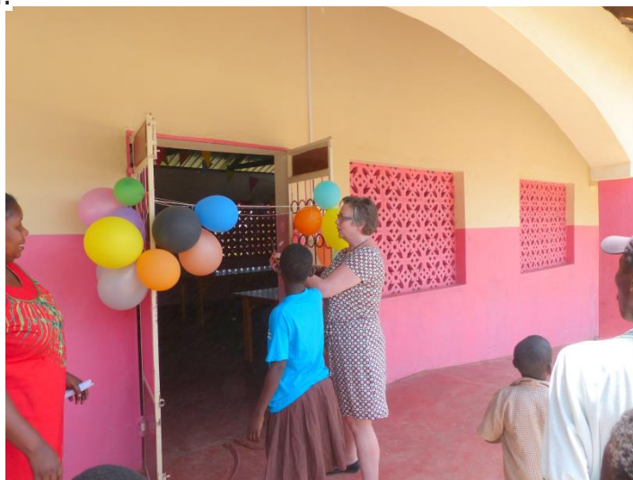
Leerling opent samen met Lidy van Wieringen de eetzaal

Workshop (praktijklokaal) met naaimachines, dormatory (slaapzaal), lokaal, keuken, laptop, groentetuin. En als laatste de eetzaal die vandaag feestelijk wordt geopend.